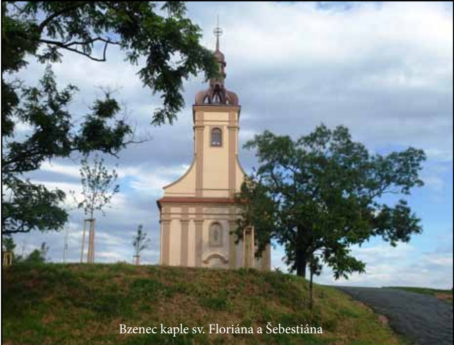
Bzenec kaple sv. Floriána a Šebestiána